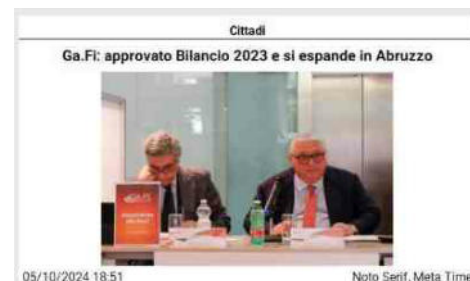
05/10/2024 18:51 Noto Serif, Meta Time