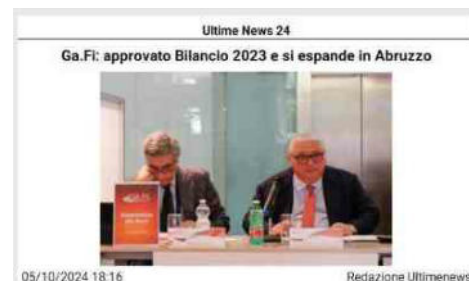
Ultime News 24 Ga.Fi: approvato Bilancio 2023 e si espande in Abruzzo 05/10/2024 18:16 Redazione UltimeneWS (Adnkronos) - Ha avuto luogo l'assemblea generale ordinaria dei soci di Garanzia Fidi Scpa (GA.FI), che ha approvato il bilancio per l'anno 2023, facendo registrare un utile di 98.766 euro, incrementato del 181% rispetto al 2022. "Un risultato -afferma Rosario Caputo, presidente di GA.FI- particolarmente apprezzabile se si tiene conto delle contingenze non favorevoli che da qualche anno caratterizzano la nostra attività. Infatti, come è ormai noto tra il 2020 e il 2023 per il massiccio intervento pubblico, il Fondo di Garanzia ha registrato un aumento di flussi di circa il 700% e di conseguenza, il peso della garanzia pubblica, sul totale delle garanzie complessive, è passato dal 65% del 2019 all'85% del 2023 a discapito della garanzia privata che è invece passata, nello stesso periodo, dal 35% del 2019 al 15% del 2023". "Ma ciononostante, il nostro confidi è stato capace di rinforzarsi. Infatti, di fronte al progressivo ridimensionamento del business legato alla garanzia mutualistica, siamo stati in grado -spiega- colmare il vuoto "fisico" lasciato dalle banche, proponendoci come consulenti finanziari a tutto campo, in cui la garanzia è, sicuramente, una componente importante ma non più l'unica nell'offerta di servizi". "Siamo diventati - conclude Caputo - un 'polo finanziario', in grado di offrire un servizio finalizzato a far conoscere i diversi strumenti finanziari e gestionali a disposizione dell'imprenditore e, soprattutto, il ricorso a soluzioni veloci e innovative laddove ne ricorrano le condizioni". Nel corso dell'assemblea sono stati resi noti una serie di dati ed indicatori, dai quali si evince che il 2023, ha segnato per GA.FI. un rafforzamento della propria funzione di "prossimità", avendo riconquistato un ruolo importante nell'affiancamento delle imprese e nel loro accompagnamento sul mercato dei capitali e del credito. GA.FI. ha registrato una maggiore copertura dei rischi che si attesta al 76% del portafoglio e un NPL ratio netto pari al 4,36%. Sotto il profilo della solidità patrimoniale, GA.FI. può vantare un indice di capitalizzazione 'Total Capital Ratio' che supera il 45%, nettamente al di sopra dei requisiti regolamentari.