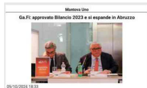
Mantova Uno Ga.Fi: approvato Bilancio 2023 e si espande in Abruzzo 05/10/2024 18:33 (Adnkronos) - Ha avuto luogo l'assemblea generale ordinaria dei soci di Garanzia Fidi Scpa (GA.FI), che ha approvato il bilancio per l'anno 2023, facendo registrare un utile di 98.766 euro, incrementato del 181% rispetto al 2022. "Un risultato -afferma Rosario Caputo, presidente di GA.FI- particolarmente apprezzabile se si tiene conto delle contingenze non favorevoli che da qualche anno caratterizzano la nostra attività. Infatti, come è ormai noto tra il 2020 e il 2023 per il massiccio intervento pubblico, il Fondo di Garanzia ha registrato un aumento di flussi di circa il 700% e di conseguenza, il peso della garanzia pubblica, sul totale delle garanzie complessive, è passato dal 65% del 2019 all'85% del 2023 a discapito della garanzia privata che è invece passata, nello stesso periodo, dal 35% del 2019 al 15% del 2023". "Ma ciononostante, il nostro confidi è stato capace di rinforzarsi. Infatti, di fronte al progressivo ridimensionamento del business legato alla garanzia mutualistica, siamo stati in grado -spiega- colmare il vuoto "fisico" lasciato dalle banche, proponendoci come consulenti finanziari a tutto campo, in cui la garanzia è, sicuramente, una componente importante ma non più l'unica nell'offerta di servizi". "Siamo diventati - conclude Caputo - un polo finanziario', in grado di offrire un servizio finalizzato a far conoscere i diversi strumenti finanziari e gestionali a disposizione dell'imprenditore e, soprattutto, il ricorso a soluzioni veloci e innovative laddove ne ricorrano le condizioni". Nel corso dell'assemblea sono stati resi noti una serie di dati ed indicatori, dai quali si evince che il 2023, ha segnato per GA.FI. un rafforzamento della propria funzione di "prossimità", avendo riconquistato un ruolo importante nell'affiancamento delle imprese e nel loro accompagnamento sul mercato dei capitali e del credito. GA.FI. ha registrato una maggiore copertura dei rischi che si attesta al 76% del portafoglio e un NPL ratio netto pari al 4,36%. Sotto il profilo della solidità patrimoniale, GA.FI. può vantare un indice di capitalizzazione 'Total Capital Ratio' che supera il 45%, nettamente al di